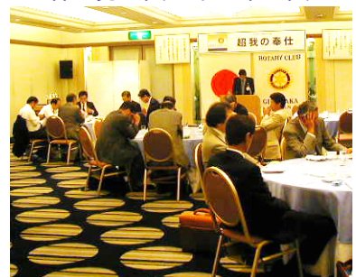
クラブフォーラム風景