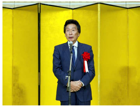
岐阜市長 細江茂光様 挨拶