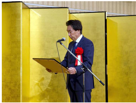
岐阜市より感謝状授与