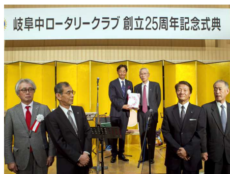
在籍 25 年会員 表彰