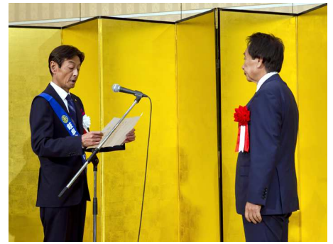
25周年記念事業 目録贈呈