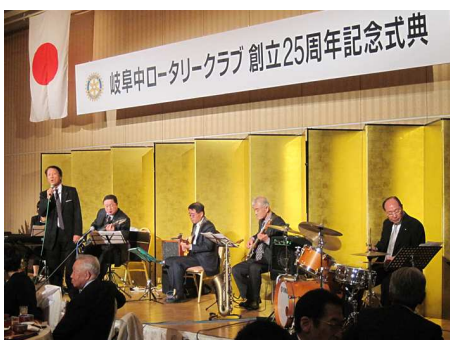
岐阜中 RC オールスターズ