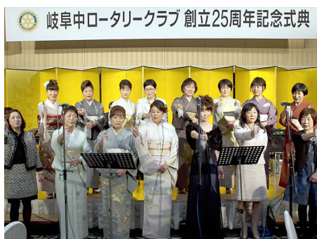
夫人の会によるコーラス