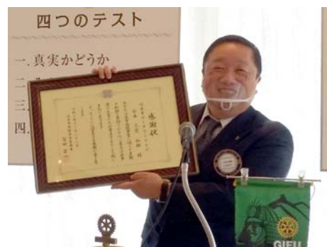
岐阜市病院管理者様からの感謝状

さて、今日は年次総会を開催し、いよいよ32期が始動する日であります。年内の例会は、今日を含めて2回となります。皆様どうかよろしくお願いたします。