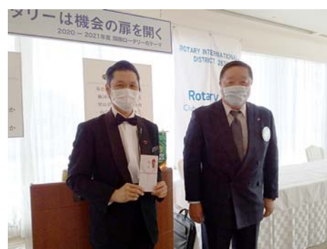
都ホテル岐阜長良川様へ半期のお礼