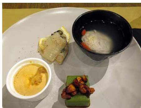
写真左) 本日のお料理