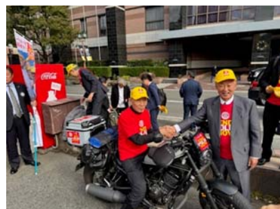
福岡東南 RC 会長と握手