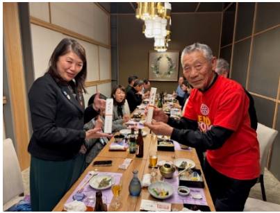
福岡東南クラブ主催歓迎会