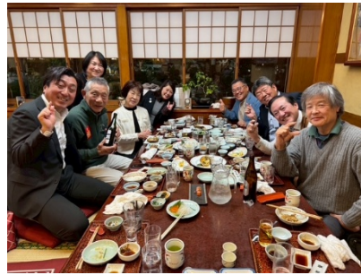
ガバナー主催歓迎会、 地区から7名も