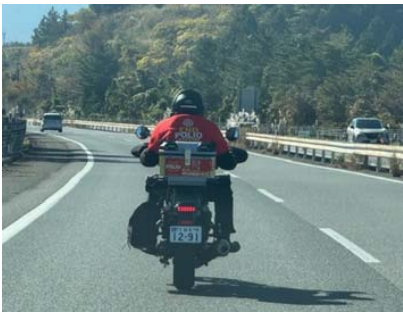
九州道でロータリアンがフォーカス