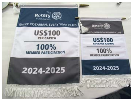
100%財団寄付クラブ 認証バナー