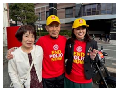
玉野ガバナーと家内がお祝いに